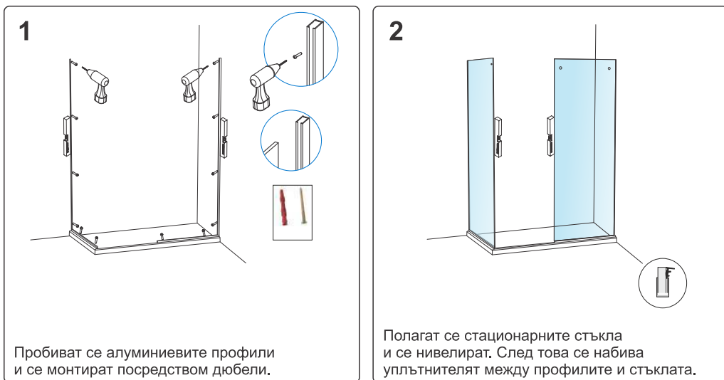
СХЕМА ЗА МОНТАЖ